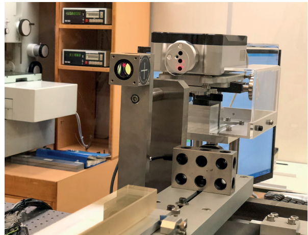
Renishaw XL-80 系列鐳射干涉儀

Renishaw XL-80 鐳射干涉儀是目前市場上真正快速、精確和便攜的校準系統。精確穩定的鐳射源和準確的 XC-80 環境補償器，保證了± 0.5 ppm 的（在空氣環境中）的線性測量精度。系統以高達 50 kHz 頻率讀取資料，最高線性測量速度可達 4 m/s，即使在最高速度下線性解析度仍可達 1 nm。所有測量選項（不只是線性）均採用干涉法測量，使您對記錄資料的精度有信心。配備先進易於使用和人性化操作的軟體，為使用者提供最全面的機器校準方案。