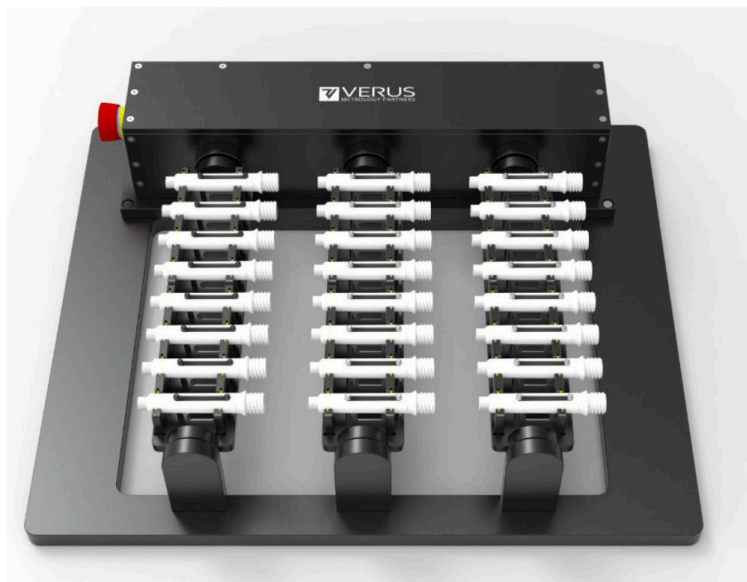
Verus Metrology Partners 的客製夾具解決方案之一

在全球面對新冠肺炎疫情 (COVID-19) 的挑戰中，快速將新冠病毒檢測試劑盒完成並出貨是致勝的關鍵。為達到塑膠試劑盒零件的大規模生產，量測環節絕不能成為掣肘整個生產流程的瓶頸。受客戶委託，來自愛爾蘭的 Verus Metrology Partners (Verus) 公司開發出可提升量測效率的全新解決方案，實現了量測速度與生產速度兼顧的雙贏。