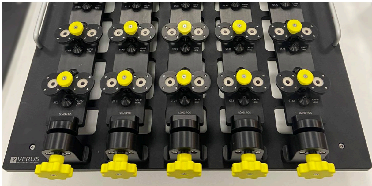
用於量測橡膠零組件的 Verus 客製型 48 工位夾具