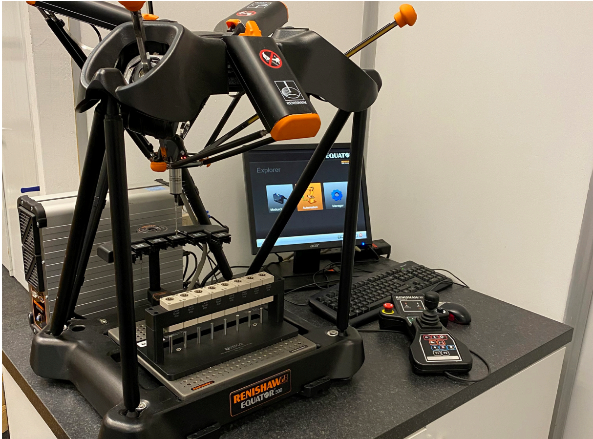
使用 Verus 的夾具承托試劑瓶和瓶蓋，以便在 Equator™ 300 上進行檢測