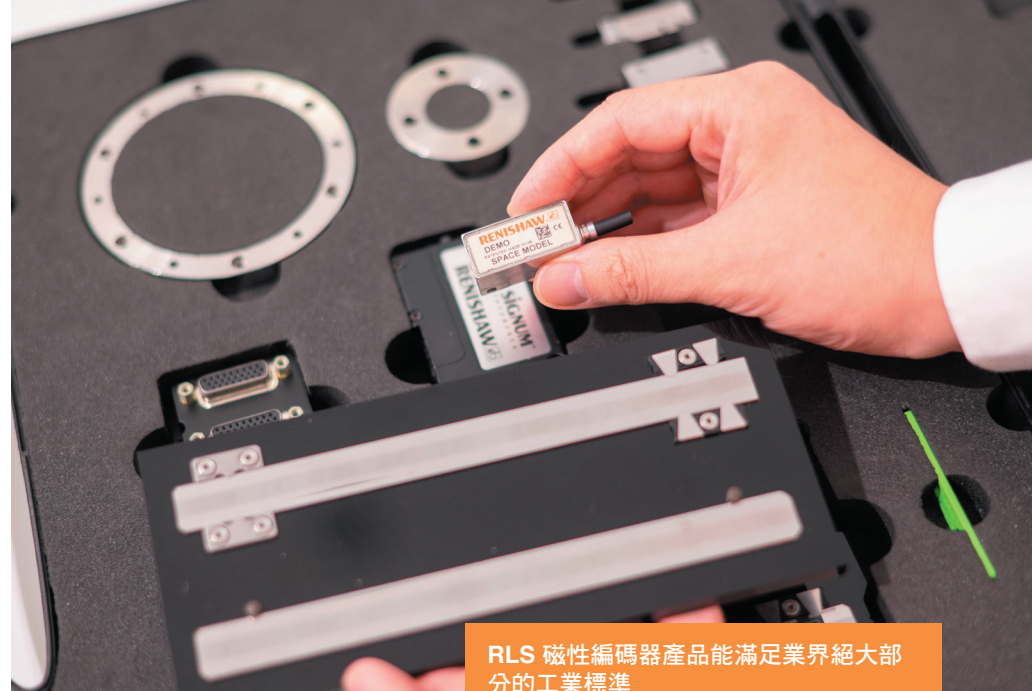
RLS 磁性編碼器產品能滿足業界絕大部分的工業標準

RLS 磁性編碼器產品在醫療領域的應用十分廣泛，包括實驗室中的樣品處理機器人、病人檢查台的位置調整，到 CT 掃描設備的速度和位置控制，再到外科手術機器人等。磁性編碼器的精度、穩定可靠性和體積等規格都是醫療設備必然考慮的因素。RLS 經過多年所累積的豐富市場經驗，產品在醫療器材領域早已得到業界認可。除了標準產品外，RLS 也會因應客戶設備的設計要求提供客製化產品方案。