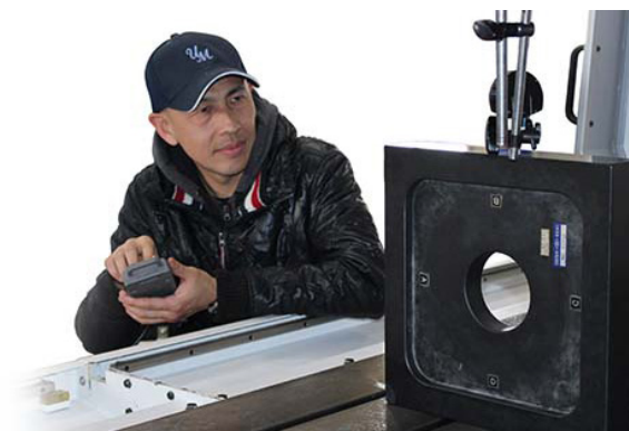
U-MACHINE 工程師正在進行精密量測

為了向二手機客戶提供動態精度量測方面的額外保障，U-MACHINE 需要一種有效的解決方案來提供其他所需的性能結果。