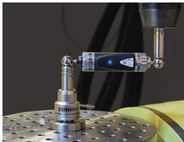
Renishaw QC20-W 循圓測試儀系統正在執行測試

Ballbar 20 軟體採集的資料用於依據國際標準（ISO 230-4 和 ANSI/ASME B5.54）計算定位精度的總體量測值（圓度、圓度偏差）。資料以圖形和數位的形式記錄和顯示，有助於快速診斷機台誤差。