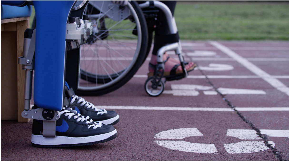
Project MARCH IVc 外骨骼機器人和傳統的輪椅同在起跑線上