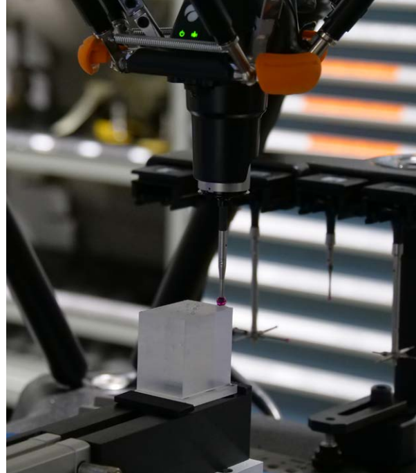
使用 Equator 檢具系統掃描精密楔形零件

由於 Equator 可直接與 CNC 機台連接，因此一旦檢測到特徵尺寸或位置偏差，可立即自動執行任何必要的刀補更新，進而將廢品率降至最低。