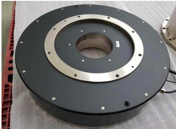
JUSTEK JTR49 系列直驅電機 (Ø490 mm OD)

Young-dong Jo 先生指出：「除了 ATOM 外，JUSTEK 生產的精密平台也有採用 Renishaw 其他光學尺型號，包括 TONiC 系列用於 OLED 面板檢測設備，以及 RESOLUTE 絕對式系列用於 OLED 面板噴墨印刷設備。讓我印象深刻的是 TONiC 光學尺系統搭配的 ZeroMet™ 線性尺，具有近乎零的熱膨脹係數，可確保在不同工作溫度範圍內保持高精度。」