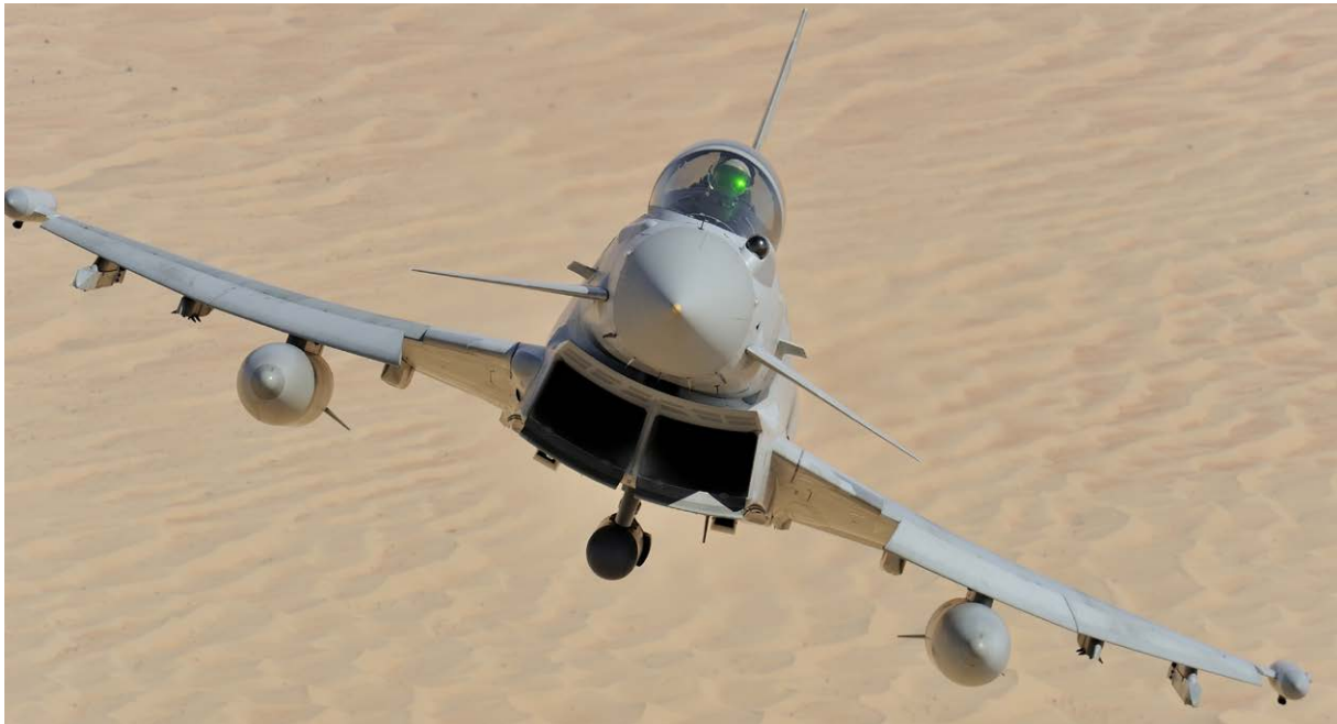
飛行中的颶風戰鬥機

在 Renishaw 循圓診斷系統的協助下，閒置的 CNC 工具機已重回生產線，BAE Systems 也因產能與品質大幅提升而受益不少。