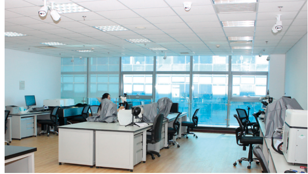
NGTC 研究部大型儀器室