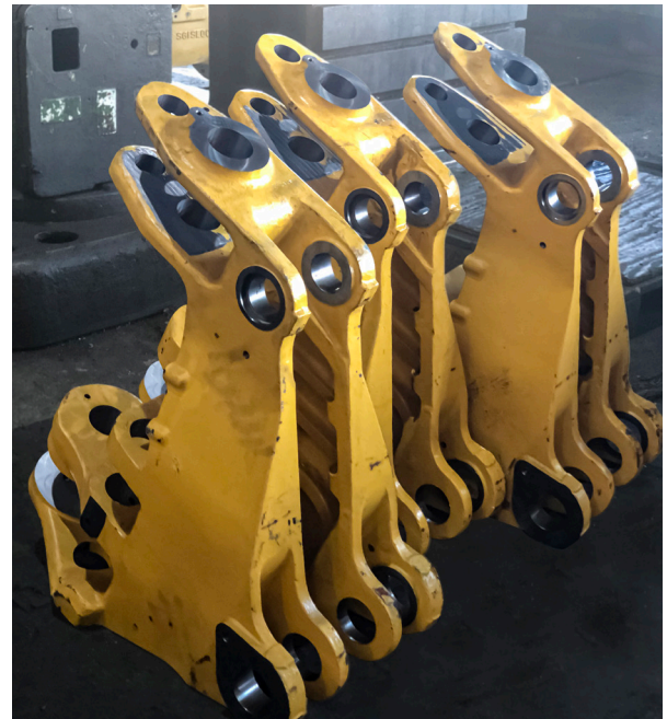
Toprak işleri sektöründe kullanılan salinim çerçevesi bileşenleri

Daha da önemlisi, PMAC'in ürün kalite denetim tesislerinin tamamı firma bünyesinde olup, uzman bir kalite yönetim ekibi tarafından kullanılan son teknoloji ekipmanlara sahiptir.