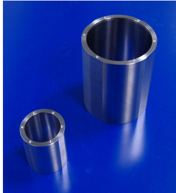
Merilni valji za svetovno vesoljsko misijo MICROSCOPE so bili izdelani s točnostjo 1 \mu\text{m} .

Zaradi visoke natančnosti, ki so jo dosegli pri izdelavi – od 1 \mu\text{m} do 2 \mu\text{m} za dimenzije, ravnost, cilindričnost (koncentričnost), vzporednost in nagnjenost vseh sosednjih ploskev na valju – je bilo mogoče določiti dimenzije teles s točnostjo do 10–15 \mu\text{m} . Fiziki v vesoljskem laboratoriju bodo tako lahko z izjemno stopnjo točnosti izmerili odziv različnih valjev na silo pospeševanja. Če bodo ugotovili razlike v odzivih, bi ta eksperiment lahko sprožil revolucijo v našem razmišljanju o fiziki trdne snovi.