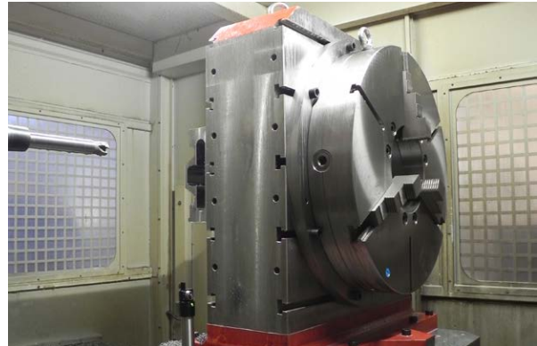
Visokonatančna motorna roka na stružnici Trevisan

Na voljo so roke za dimenzije vpenjalnih glav stroja od 6 do 24", skupaj s konfiguracijami tipal za vsa standardne velikosti orodij med 16 in 50 mm.