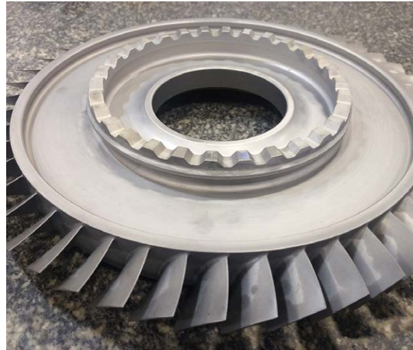
После: завершённое моноколесо

«Рассмотрев варианты, мы решили приобрести станочный датчик RMP600 с передачей данных по радиоканалу. Такое решение сочетало все преимущества автоматизированной подготовки к технологической