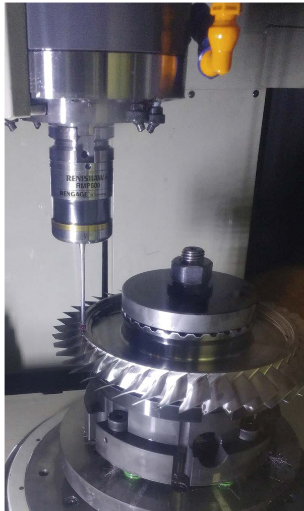
Высокоточный контактный датчик Renishaw RMP600

В процессе обработки датчик Renishaw касается заготовки в различных точках и выявляет все погрешности положения.