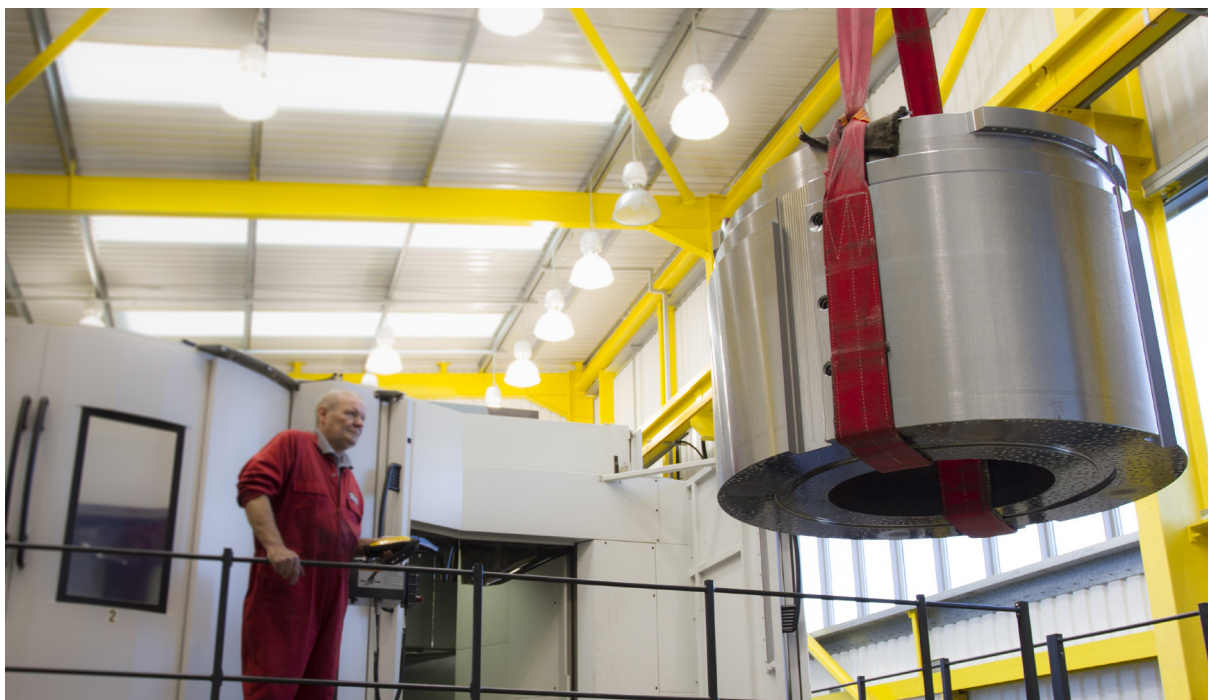
Компания Intoco использует станок Mazak INTEGREX e-1850V для обработки деталей большого радиуса

На центре Mazak INTEGREX e-1850V компании Intoco установлено также программное обеспечение Inspection Plus компании Renishaw для обрабатывающих центров. Этот комплексный программный пакет на базе макросов предусматривает средства векторных и угловых измерений, печати результатов измерений и включает