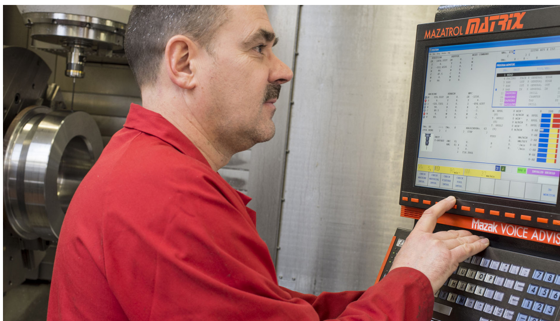
Компания Intoco использует станочные измерительные системы компании Renishaw на своих станках Mazak INTEGREX

Компания Intoco, предприятия которой находятся в Ставертоне около Челтнема (Великобритания), представляет собой показательный пример производителя-субподрядчика, пользующегося преимуществами применения контактно-измерительных систем компании Renishaw.