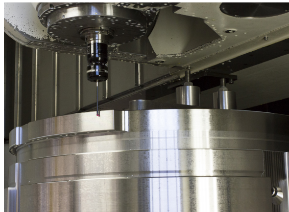
Компания Intoco использует измерительные системы компании Renishaw Intoco для измерения параметров крупногабаритных деталей в процессе их изготовления

«В настоящее время 50 % наших мощностей работают на сектор экструзии металлов, кроме того, мы производим детали для нефтегазовой промышленности, зеленой энергетики и фармацевтической отрасли, — говорит Ван Паркинс (Wayne Parkins), инженер-разработчик