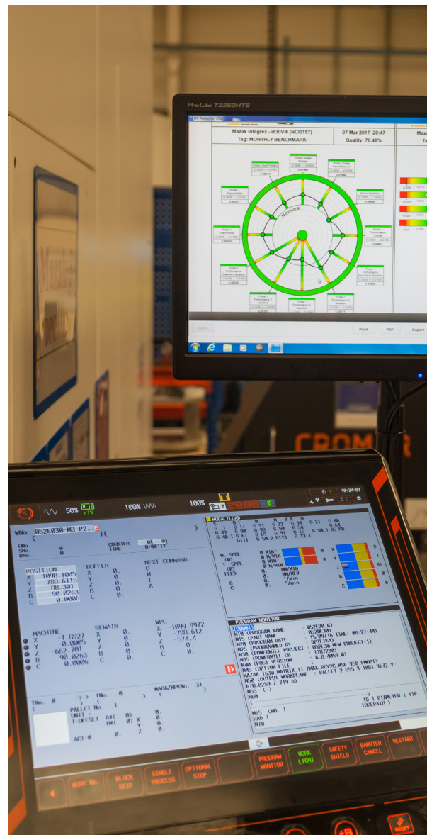
Ежемесячная проверка производительности с помощью программы NC-Checker