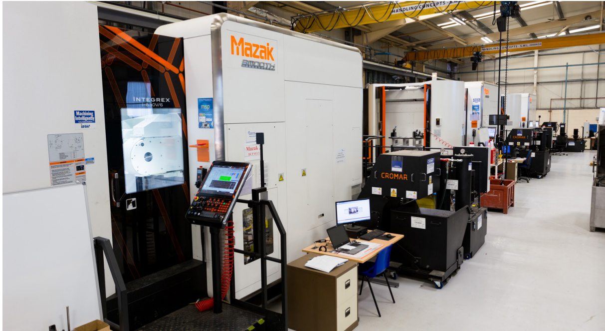
Производственный объект Doncasters Precision Castings — Deritend

до восьми часов и требовала присутствия высококвалифицированного оператора для контроля процесса обработки. Теперь на обработку таких деталей уходит те же два часа, что и на простых, поэтому экономия еще ощутимее. При помощи Renishaw и MSP компания Doncasters улучшила системы базирования и добилась впечатляющих общих результатов; также была улучшена корреляция результатов контроля на станке, результатов контроля на КИМ и данных системы сканирования Bluelight.