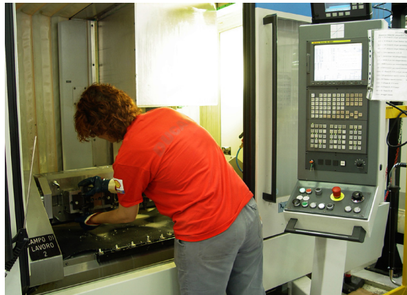
Jeden operator może z łatwością obsługiwać obie obrabiarki – wystarczy załadować przedmioty obrabiane i sprawdzać, czy wszystko przebiega płynnie