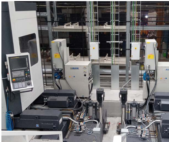
Trevisan-machines gekoppeld in de FMS

Door de meettastersystemen voor bewerkingsmachines van Renishaw te integreren voor het instellen en meten van kleponderdelen en snijgereedschappen, heeft Trevisan Machine Utensili voor zijn klant een flexibel productiesysteem gecreëerd waarmee de precisie en productiviteit gemaximaliseerd kunnen worden.