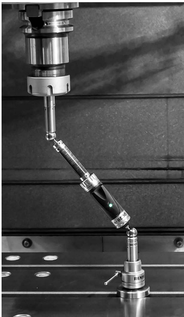
StankoMachComplex gebruikt de QC20-W ballbar om de conditie van bewerkingsmachines te bewaken

Nadat draai/freesmachines met rotatieassen in productie waren genomen, kocht StankoMachComplex een XR20-W kalibrator voor rotatieassen die een rotatieas kan meten tot \pm 1 boogseconde. Het systeem levert een uiterst betrouwbare contactloze referentiemeting, op een afstand van de geteste as. Met gebruik van de Off axis rotatiesoftware kan de XR20-W zowel op als buiten de rotatieassen van de machine gemonteerd worden.