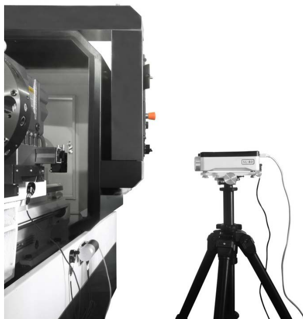
De nauwkeurigheid van bewegingen op bewerkingsmachines controleren met het XL-80 lasersysteem

Al sinds oprichting van het bedrijf staat kwaliteit voorop. Bewerkingsmachines van StankoMachComplex voldoen aan zeer strenge productspecificaties, Russische staatsnormen en internationale kwaliteitsnormen van ISO 9000.