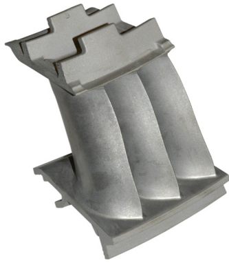
AEREO schoepgedeelte van EMA