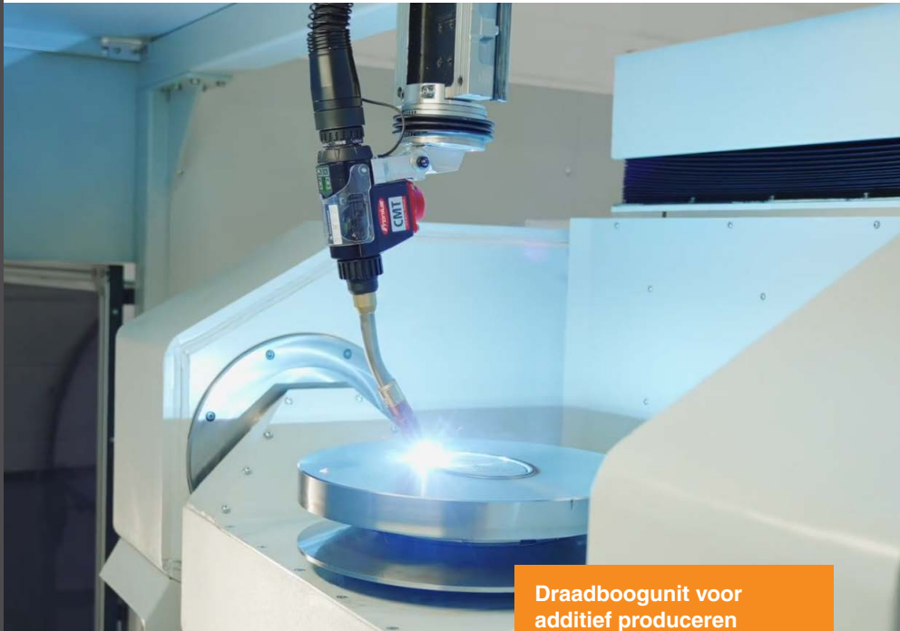
Draadboogunit voor additief produceren

Het team van Effective CNC heeft een alles-in-één machine ontworpen en gebouwd, die zowel additieve als subtractieve bewerkingen in combinatie kan uitvoeren. Ze verwachten dat dit een revolutie wordt voor de rentabiliteit van grote metalen precisieproducten maken met AM.