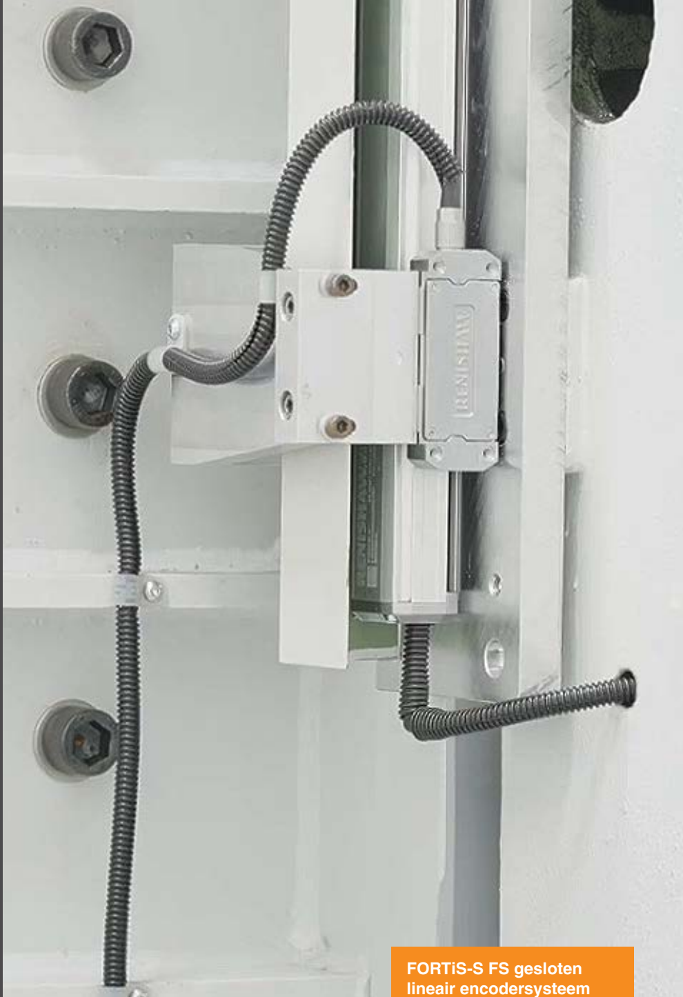
FORTiS-S FS gesloten lineair encodersysteem

Het basisontwerp van de machine omvat een producthouder, een spindel om het product te frezen en te slijpen, en een draaibare revolverkop voor gereedschappen. Een kantelbare tafel ondersteunt de bouwplaat en vormt de 4e en 5e as van de machine.