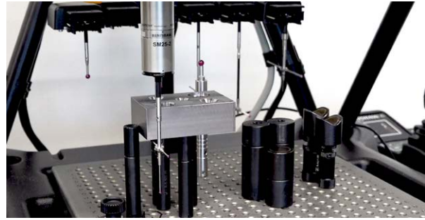
Het Renishaw Equator meetsysteem inspecteert een bewerkt NIMS-product