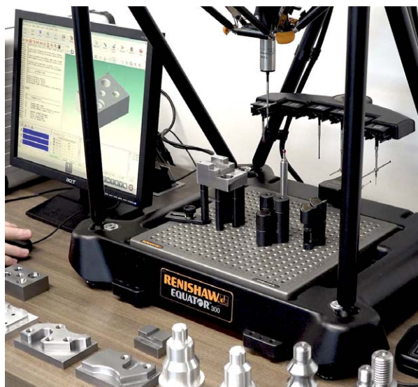
Het complete Renishaw Equator meetsysteem pakket voor NIMS

Om de vaardigheden van studenten op gelijke tred te houden met wat hedendaagse productiebedrijven doen, laten veel vakscholen in de VS hun opleidingen certificeren door het National Institute of Metalworking Skills (Nationaal instituut voor vaardigheden in metaalbewerking) ofwel NIMS. In directe aansluiting hierop heeft het wereldwijd actieve technologiebedrijf Renishaw het Equator™ meetsysteem pakket ontwikkeld dat de inspectie van NIMS-producten aanmerkelijk verbetert. Renishaw zorgt ervoor dat het systeem gemakkelijk te gebruiken is en dat de gebruikers bij elke stap goed ondersteund worden.