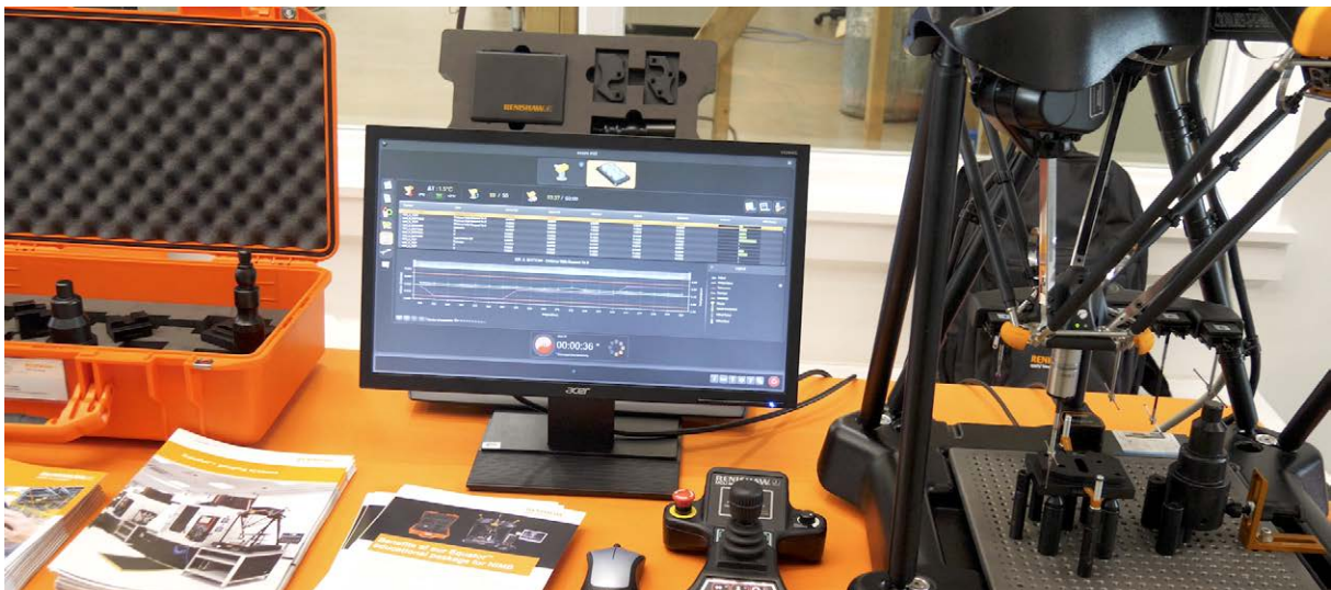
Het Equator meetpakket voor NIMS bevat al geschreven programma's, styli, twee opspanplaten voor metingen, en opspanelementen voor alle 13 producten

Invmiddels heeft Renishaw een aantal van deze pakketten geleverd aan scholen en technische vakopleidingen in de VS die NIMS-diploma's aanbieden en voor industriële stageplaatsen.