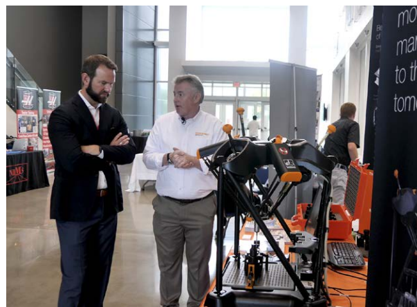
Demonstratie van het Equator meetpakket voor NIMS tijdens de jaarlijkse Haas Tech conferentie (HTEC)

// De benoeming tot NIMS-inspecteur heeft enorme voordelen gebracht, want daardoor kunnen scholen de bewerkte producten bij henzelf inspecteren. Maar het kan lastig zijn om grote volumes producten consistent en in een korte tijd te controleren. Het Renishaw Equator pakket stelt studenten in staat hun eigen producten te inspecteren en binnen 3 minuten te weten of het goed- of afgekeurd is. Ze leren wat er eventueel fout is en hoe ze dat meteen kunnen verhelpen. //