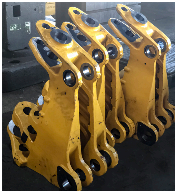
Oscillerende armen gebruikt in de grondverzetindustrie

Kwaliteit is altijd een fundamentele hoeksteen geweest van alle werkzaamheden van PMAC. De precisieproductieprocessen en -procedures voldoen aan erkende nationale en internationale normen.