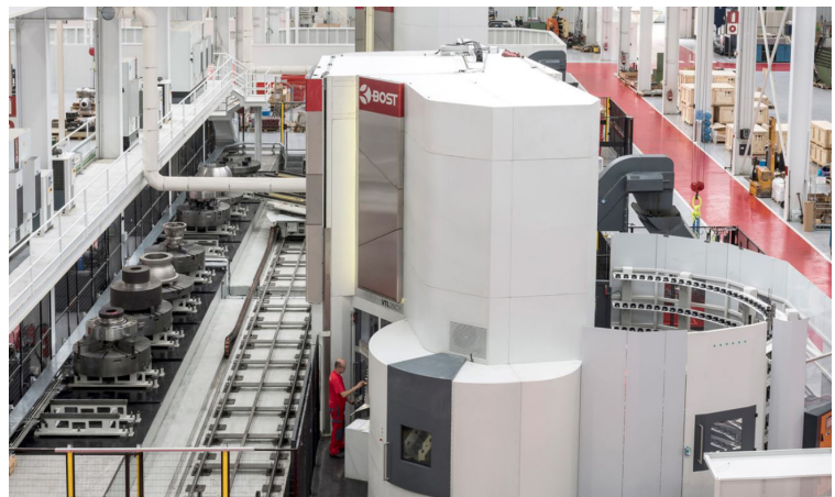
아스테아수에 위치한 BOST의 생산 시설(스페인)

BOST는 혁신을 위해 멈추지 않으며 계속해서 클라이언트들에게 아주 유연하며 개인화된 서비스를 제공합니다. 모든 기계는 기하학적 정밀도, 반복도, 부하 테스트를 포함하는 엄격한 검증 프로세스를 거친 후 출고됩니다.