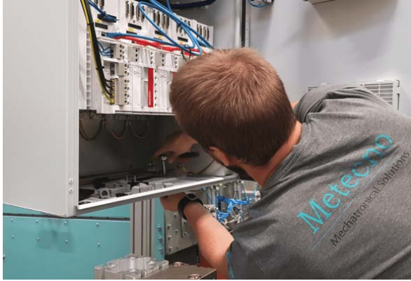
CNC 기계를 조립 중인 Metecno Oy 엔지니어