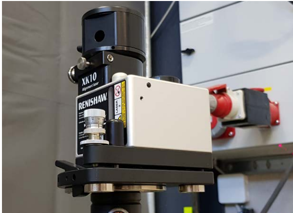
XK10 발사기에서 제공하는 다용도 고정 솔루션

"XK10에 투자를 통해 여러 장소에서 기계 정확도를 검증할 수 있게 되었다"라고 Similä는 전했습니다. "이 점은 이 프로젝트에서 특히 유용했는데, 그 이유는 작업을 마친 후 고객 부지로 운송하기 위해 기계를 해체해야 하기 때문입니다. 작업장에서 기계를 재조립한 후에 XK10을 사용하여 기계를 재점검할 수 있으므로 고객에게 정확성이 검증된 기계를 인도할 수 있습니다."