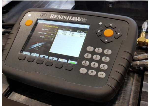
휴대용 XK10 디스플레이 장치를 통한 실시간 피드백

자세한 정보는 www.renishaw.co.kr/xk10 에서 확인하십시오.