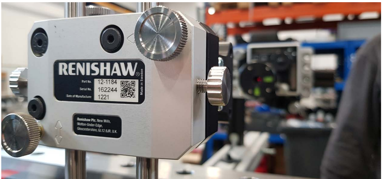
기계 축에 정렬된 XK10 평행도 키트

Renishaw의 핀란드 지역 영업 관리자인 Isto Tuomisto는 "하청업체를 통해서도 Metecno Oy의 모든 맞춤형 기계의 품질을 보장할 수 있지만 일부 측정 프로세스를 내부에서 진행하는 것이 제조업체와 고객사 모두에게 유리할 수 있다는 사실을 잘 알고 있었다"라고 설명하며 부연했습니다. "XK10은 기계 제작을 지원하는 용도로 개발되었습니다."