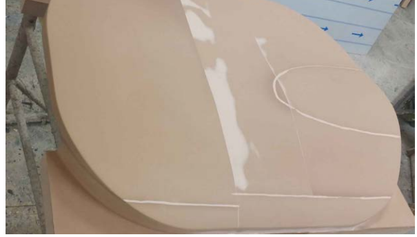
유리 섬유 커버 제작을 위해 16개 섹션으로 된 금형을 만들고자 세팅하는 공정에 OMP40 공작물 세팅 프로브와 TS27R 공구 세팅 프로브가 사용되었습니다.

자동차의 후면에서 뺀어나온 덮개가 좌석을 모두 덮어 운전석만 외부로 노출되었습니다. 이러한 디자인 때문에 Equinox 3D는 여러 개의 섹션 패턴, 즉 총 16개의 섹션을 만들어야 했습니다. 유리 섬유 금형의 수작업 다듬질을 최소화하기 위해서는 이 섹션들이 서로 정확하게 맞춰져야 했습니다.