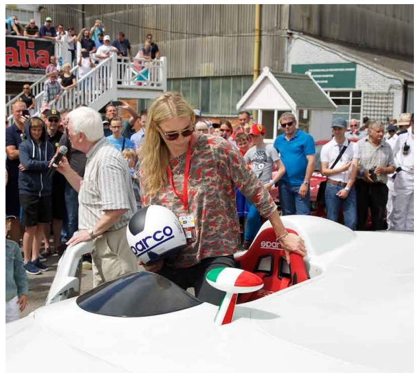
‘베스트 오브 이탈리아 페스티벌’로 향하기 직전에 브루클랜드스에서 슈퍼모델이자 카레이서인 Jodie Kidd가 완성된 제품을 공개했습니다.