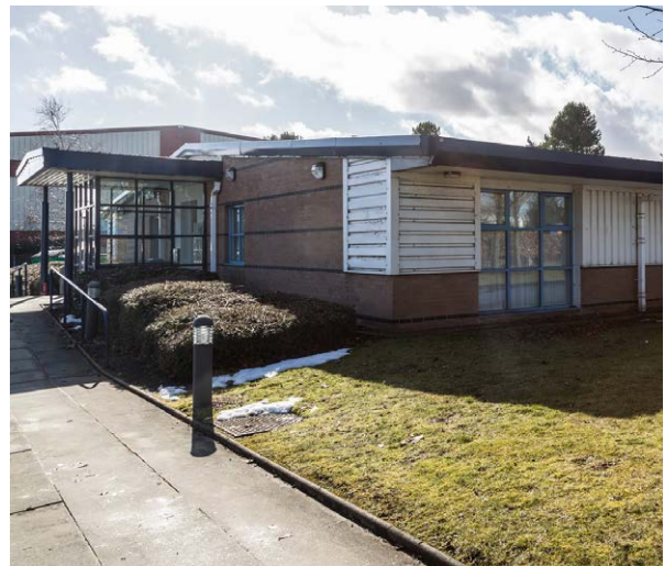
Apex의 본헤드 시설