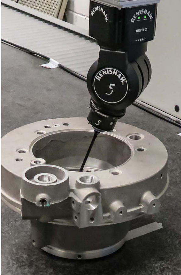
무한 포지셔닝 기능을 제공하는 REVO 5축 헤드

초창기부터 Renishaw와 긴밀하게 협력해 온 Apex는 PH10 모터 구동식 각도분할형 헤드에 장착된 스캔 프로브와 전통적인 접촉식 트리거를 사용하는 3축 CMM 시스템이 포함된 설치 기반 사내 CMM 장비 서비스를 제공했습니다.