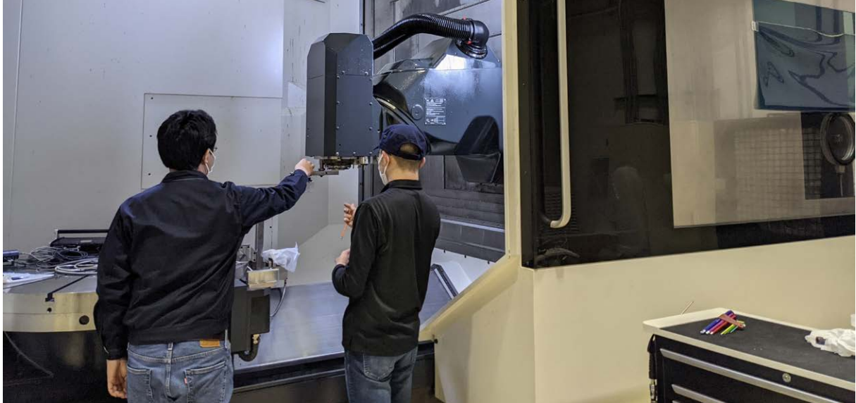
정확도 측정 가공 센터