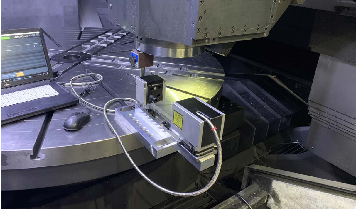
XM-60 다축 캘리브레이터로 공작 기계 정확도 측정

Volumetric Accuracy Research Institute Co., Ltd.(일본) //