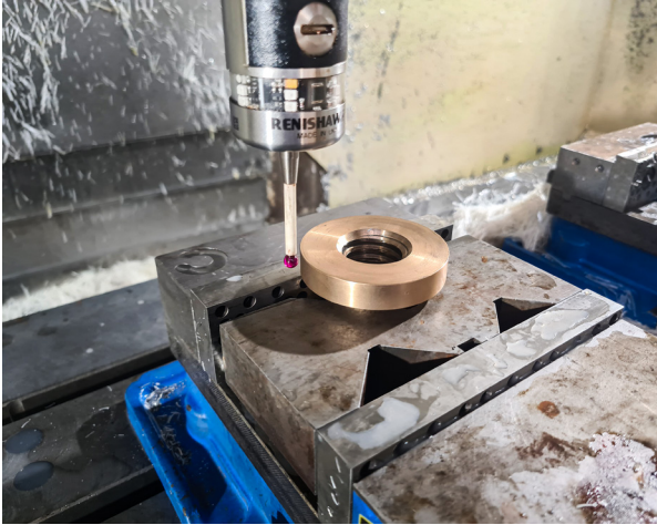
Renishaw OMP40-2 옵티컬 프로브를 사용한 공작물 셋업 및 검사