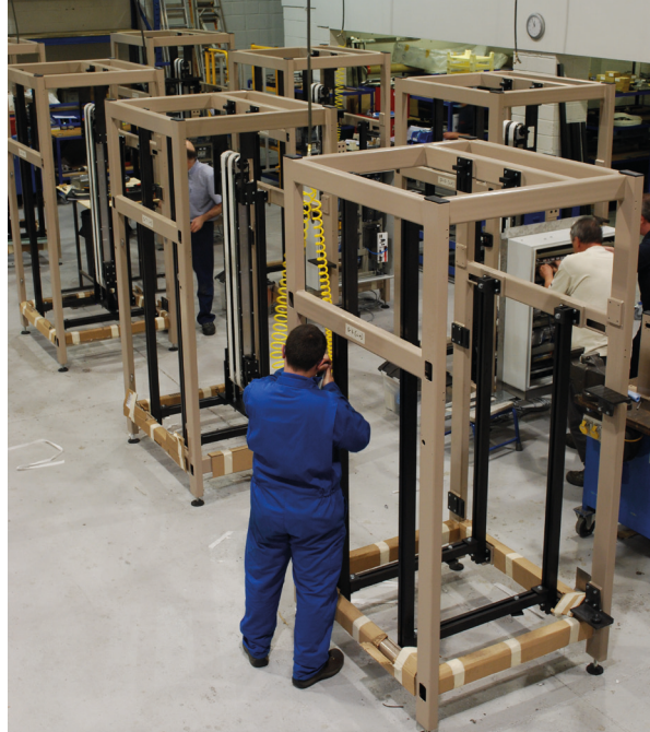
ソーテック社は世界のチョコレート、ビスケット、紅茶などの食品メーカー、その他消費者向け量産品メーカーに製造機械設備を供給

レニショーの各種工作機械用プローブ製品及びソフトウェア製品についての詳細は、 www.renishaw.jp/mtp をご参照下さい。