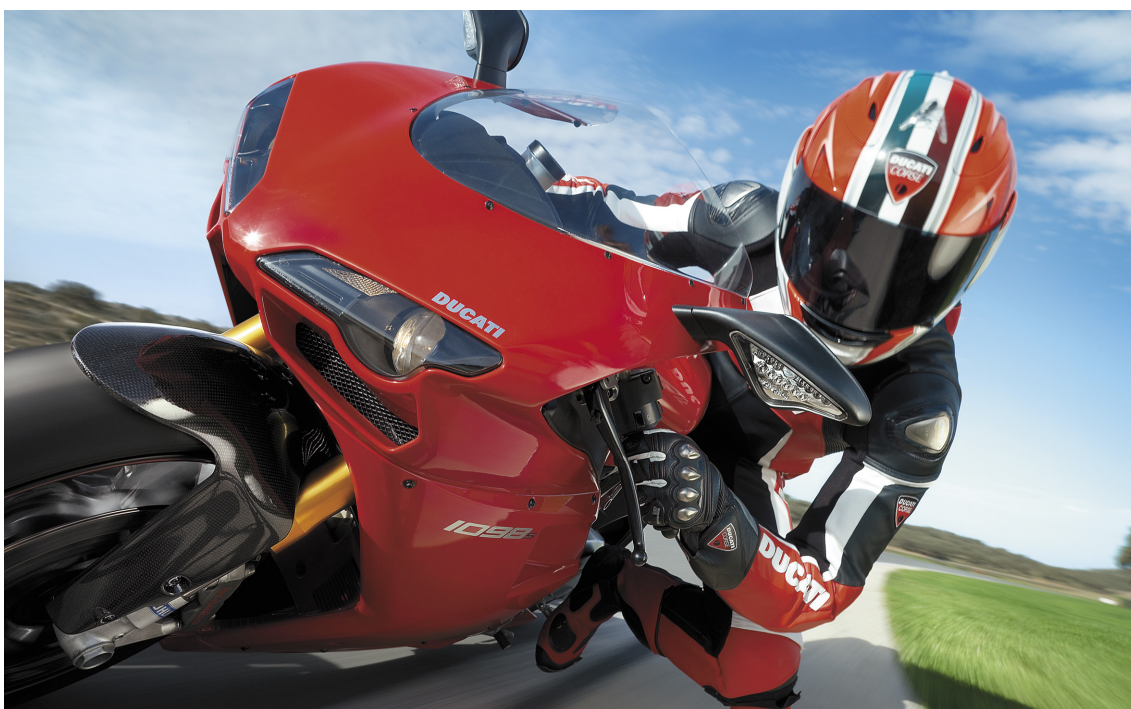
ドゥカティのエンジニアは、1972年以来、高速時の高い信頼性を確保するために、デスモドロミックシステムを採用しています。

カムシャフト製造プロセスでの工具折損は、特に深刻で、スクラップ、高額な再加工、そして時間の無駄につながります。たとえば、機械の主軸を損傷することがあれば、特殊な工具自体の費用に加えて、合計数千ユーロの出費になることが考えられます。