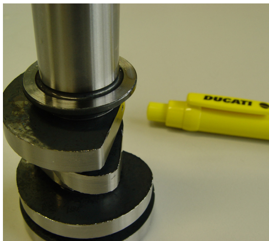
デスモドロミックカムシャフトは、特殊なリフティングランプを使用して設計されています。

これは、非常に高価なコンポーネントです。特殊な合金鋼製で、加工が始まる前の最初の荒削り後のブランクの状態でも高価な資材です」。