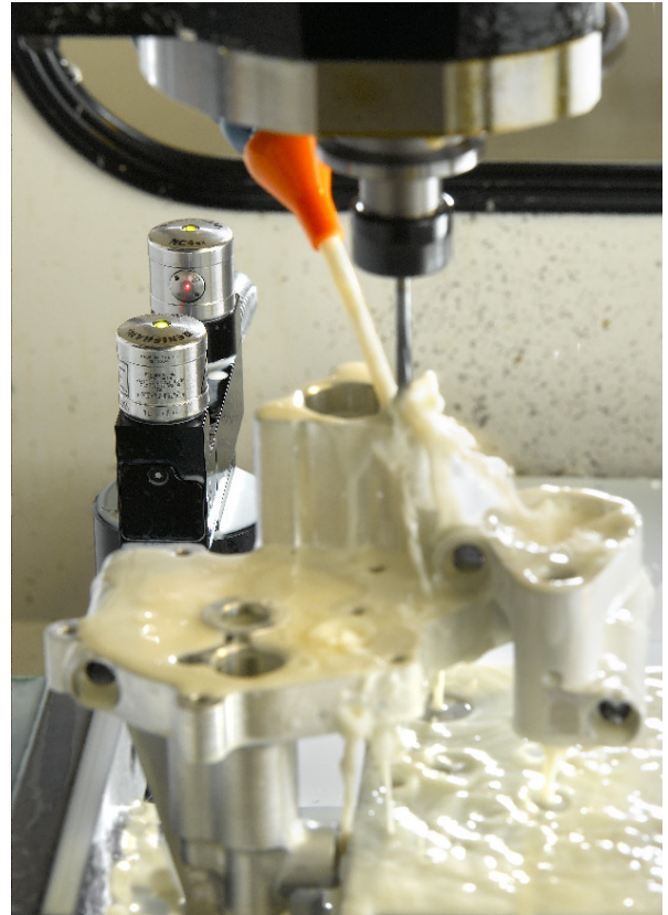
工具折損により引き起こされる非常に高価なパーツへのダメージを回避するために、レニショーのNC4システムを使用、スクラップ、再加工、および時間の無駄を排除しています。

さらに彼はこう続けます。「NC4は、エンジンが適切に作動するために不可欠となるカムのキーや他のリファレンスポイントの加工のために使われる小型の工具の折損も検出できます。レニショーシステムがなかったら、折損した工具を使用して機械を稼働させることになり、大損害を被る結果になる可能性があります。さらに、工具の折損検出が自動的に行われるため、一人のオペレータが簡単に2台の機械を管理できます。オペレータは、ワークをセットし、すべてがスムーズに作動していることを確認するだけです」。