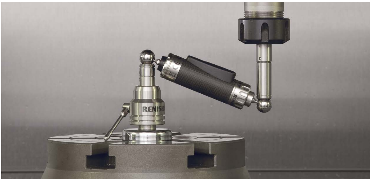
工作機械の性能診断用レニショー QC20-W ワイヤレスボールバー

レニショーのボールバー診断のおかげで、眠っていた CNC 工作機械が生き返り、工場の生産性の向上や品質保証遵守の確保から BAE Systems 社はメリットを受けています。