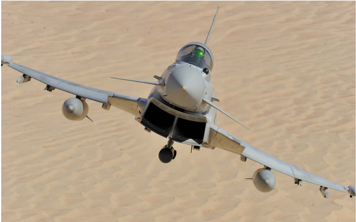
飛行中のユーロファイタータイフーン

詳細については、 www.renishaw.jp/baesystems をご覧ください。