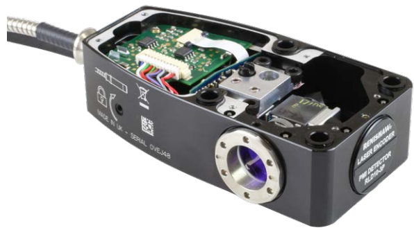
RLE のコンパクトなレーザーヘッド

レニショーエンコーダの測定軸は公称としては、測定ポイントでカメラ軸と交差します。レーザーによる測定ポイントとパーツ上の測定ポイント間の誤差は実質ありません。また、RLE のレーザーヘッドはコンパクトなため、安定性を確保したまま様々な設計に組み込むことができます。」(Land 氏)