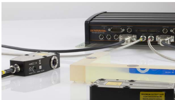
RLE レーザー干渉計エンコーダシステム

アメリカ合衆国ペンシルベニア州ピッツバーグに本拠を構える Aerotech 社は、高精度位置決めテーブル、ステージ、システムでその名が知られています。1970 年の創立以来、産業や行政、科学、研究機関に携わる世界各地の顧客に向けて、精力的に精密モーションコントロールソリューションを開発し続けています。Aerotech 社の顧客は、「より良く、より強く、より速く」を目指しており、言い換えると、常に精度向上を追い求めています。そういった顧客に対して Aerotech 社は、測定の不確かさの原因となる変動要素を考慮した、例えばエンコーダなどの細部までこだわった、モーションコントロール製品の開発を通して応えています。