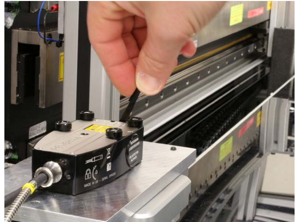
RLE の取付けとアライメント調整の様子

「Machine positioning uncertainty with laser interferometer feedback (レーザー干渉計によるフィードバックを使った、機械位置決めの不確かさ)」(2016年1月 Aerotech 社発行)。レニショー RLE システムの性能がハイライトされています。また、レニショー発行の環境補正についてのホワイトペーパーについても言及されています。