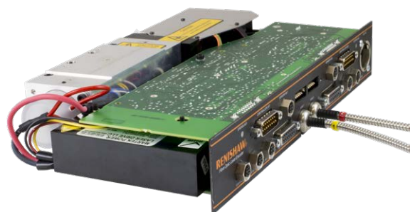
RLU レーザーユニット

シンプルなシステム構成と精度を備えるレニショーエンコーダには、アセンブリに直接組み込むことができる、など実装上の利点もあります。Aerotech 社が採用している RLE20-DX-DG レーザー干渉計エンコーダは、最大分解能 10nm のダブルパスホモダイン干渉計です。レーザー干渉技術では、波長が、測定装置を表す基本単位です。そのため、波長の安定性が、測定の繰返し精度に直結します。