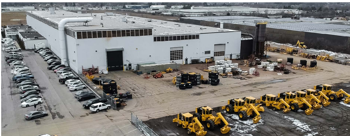
Tigercat Industries Inc. - Cambridge, Ontario, Canada.

Da quando Tigercat è entrata in partnership con Renishaw, automatizzando i processi di ispezione in macchina, è riuscita ad aumentare la propria produttività settimanale del 40% e prevede di riuscire a migliorare ulteriormente questo dato nel prossimo futuro.