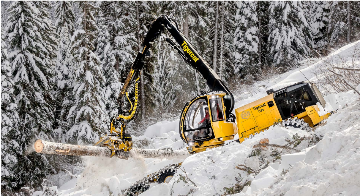
1185 Harvester

Inoltre, la sua produzione giornaliera risulta più costante e l'azienda può trarre vantaggio dalla maggiore libertà degli operatori, che ora sono in grado di spostarsi da un centro di lavoro a un altro in base alle esigenze produttive. Il rischio di errore è stato praticamente eliminato e la sicurezza degli operatori è aumentata perché gli interventi umani sono stati ridotti.