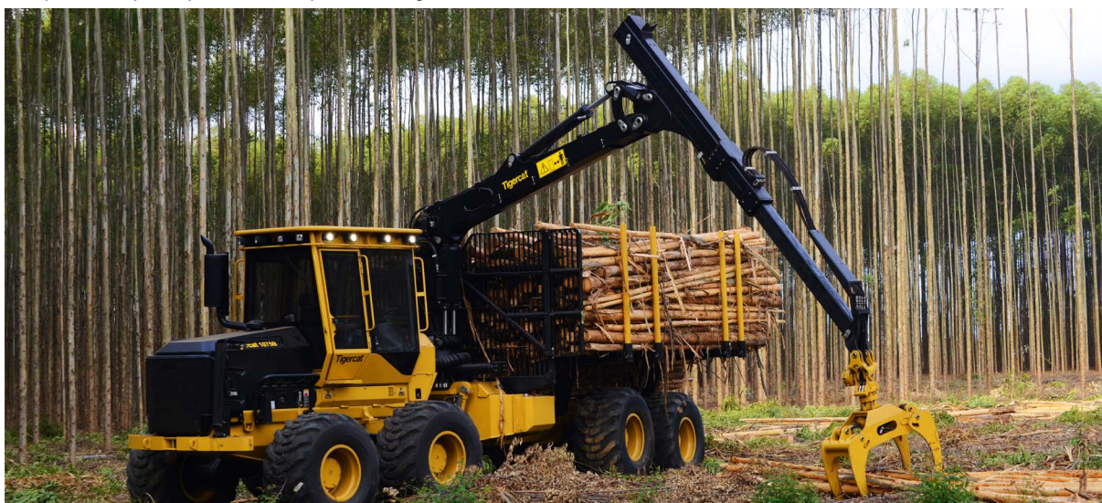
1075 Forwarder

RMP60M è una sonda a mandrino con trasmissione radio pensata per l'impostazione e l'ispezione dei pezzi lavorati tramite macchine multitasking e centri di lavoro. Questa sonda viene utilizzata da Tigercat sull'intera linea produttiva del proprio stabilimento.