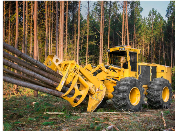
724G Feller Buncher

La sonda sfrutta la tecnologia RENGAGE™ di Renishaw che consiste in una combinazione di componenti estensimetrici al silicio ed elettroniche ultracompatte, in grado di produrre misure ad elevata accuratezza anche con stili lunghi e personalizzati come quelli utilizzati da Tigercat per l'ispezione di elementi situati in aree difficilmente raggiungibili.