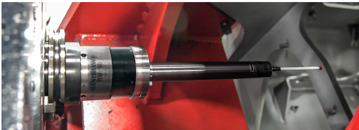
Sonda Renishaw RMP60M per macchine utensili