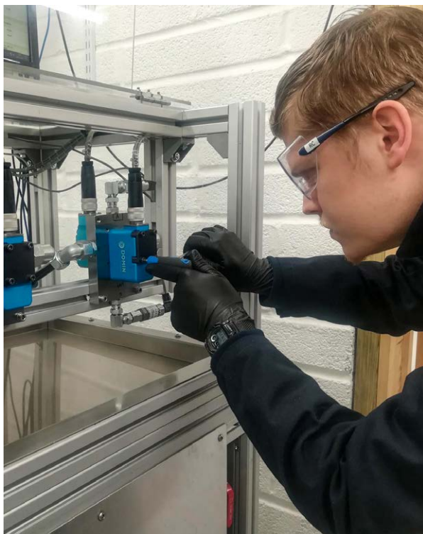
Valvole ad azionamento diretto di Domin prodotte tramite stampa 3D in metallo

Con la stampa 3D, il componente viene costruito, strato dopo strato, utilizzando polveri di metallo. Le lavorazioni additive offrono una straordinaria libertà progettuale che ha permesso a Domin di creare pezzi complessi, senza bisogno di utensili speciali, e di ridurre al minimo le operazioni di assemblaggio. Ad esempio, la stampa 3D in metallo consente di progettare geometrie complesse e ricche di elementi interni quali reticoli e canali di raffreddamento. Si possono produrre componenti con un eccellente rapporto peso/resistenza, riducendo inoltre gli sprechi.