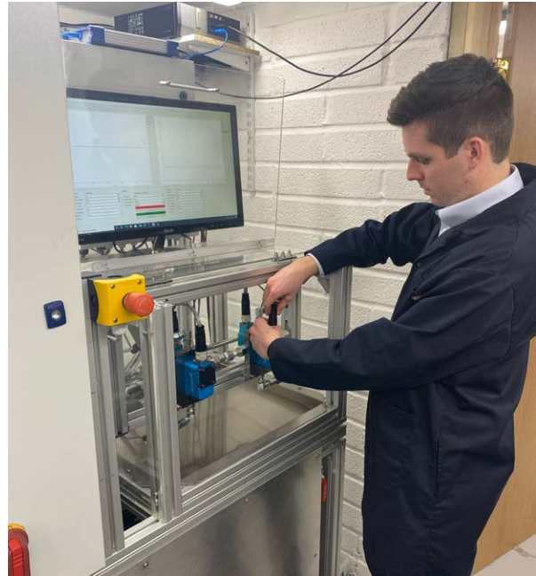
Verifica di una valvola ad azionamento diretto prodotta tramite AM

"Ogni valvola che vendiamo fa risparmiare una tonnellata di CO 2 rispetto ai prodotti alternativi", aggiunge Pont. "Il nostro prossimo obiettivo è quello di ottimizzare l'efficienza dei sistemi idraulici del 400% per fare davvero la differenza a livello di emissioni globali".