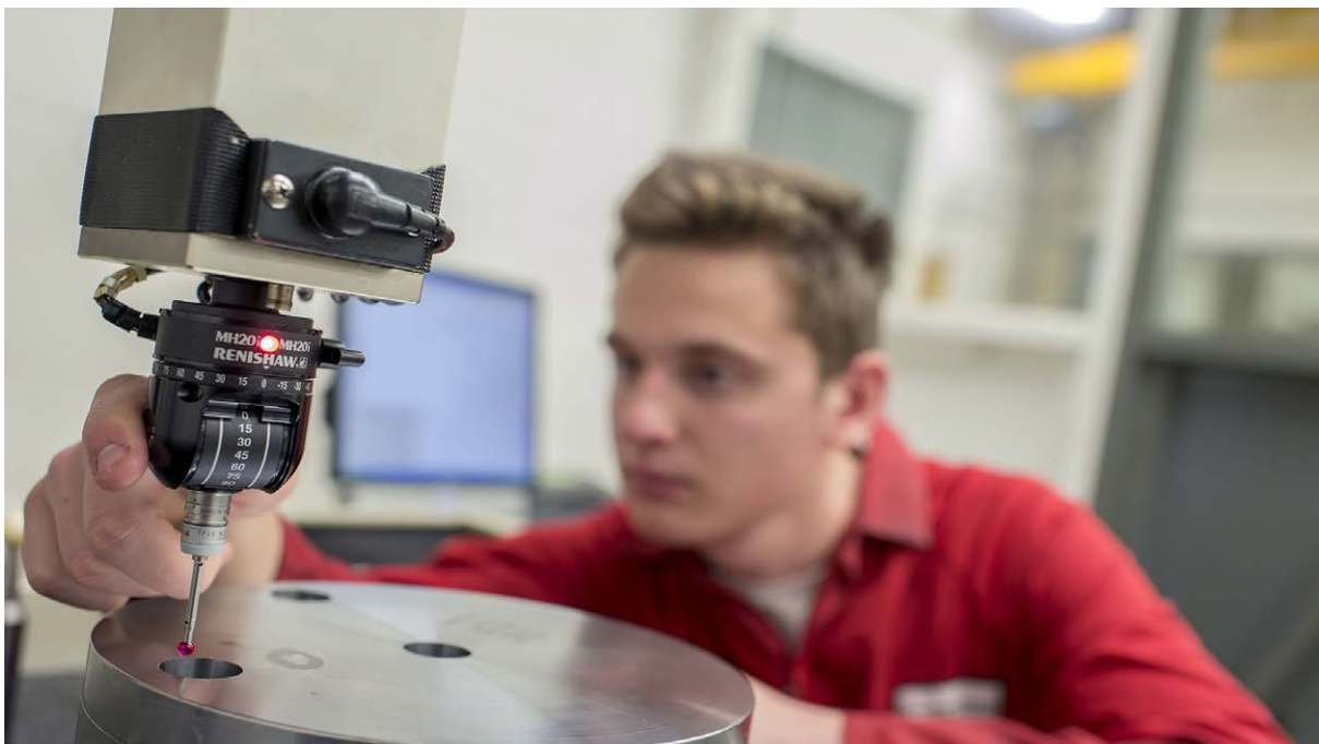
Intoco ha inoltre installato nella sua CMM la sonda Renishaw MH20i con regolazione manuale