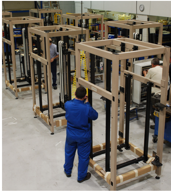
Le macchine Sewtec sono destinate ad aziende internazionali che si occupano principalmente di dolci, biscotti, tè e altri beni di consumo

Quasi il 90% delle macchine viene inviato all'estero, a clienti che si occupano di produrre e imballare articoli molto vari: dolci, biscotti, tè e altri beni di consumo.