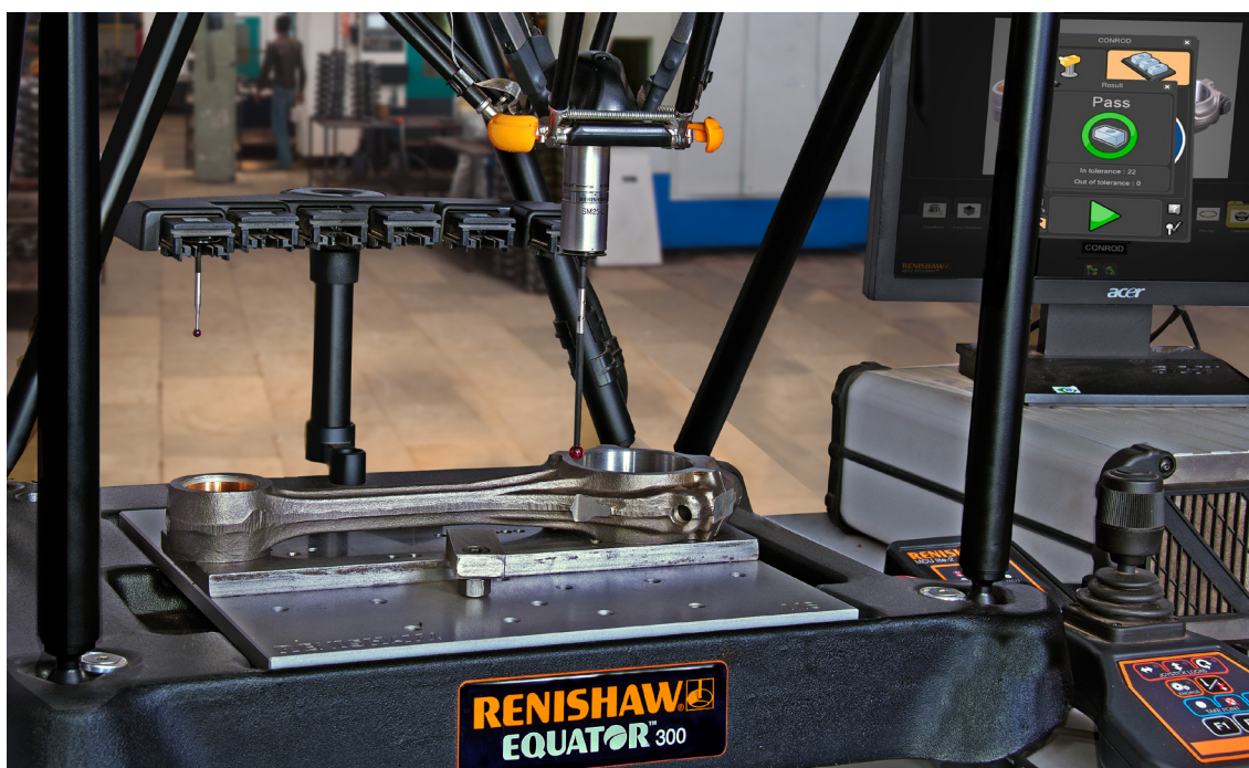
Biella Kishan Auto con EQ33

un’unica operazione in modo passa - non passa. Al termine, viene stilato un rapporto con le dimensioni del componente. Nonostante la sua sede sia a Rajkot, nello stato indiano del Gujarat, dove le temperature oscillano tra i 19 °C e i 40 °C, Kishan è in grado di ottenere risultati ripetibili grazie al suo sistema Equator.