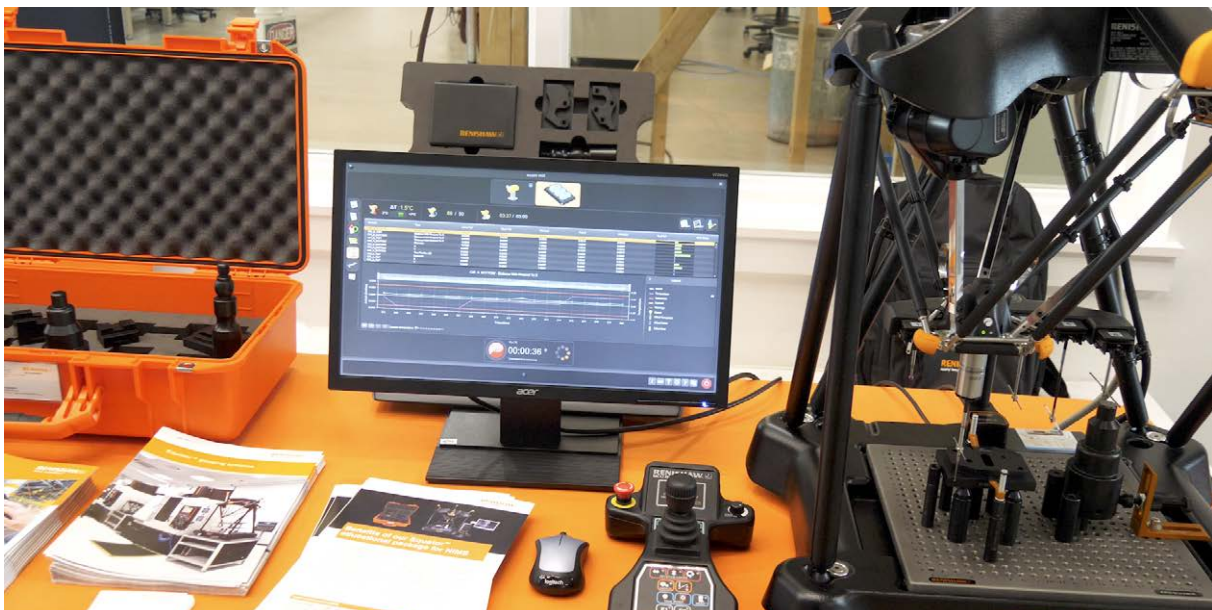
Il sistema di ispezione Equator dedicato al NIMS include programmi già pronti, stili, due tavole per fissaggi metrologici e fissaggi adatti a tutti e 13 i pezzi.

Renishaw ha fornito molti di questi sistemi “chiavi in mano” a istituti superiori a orientamento tecnico statunitensi che offrono la certificazione NIMS e a dipartimenti di formazione aziendale.