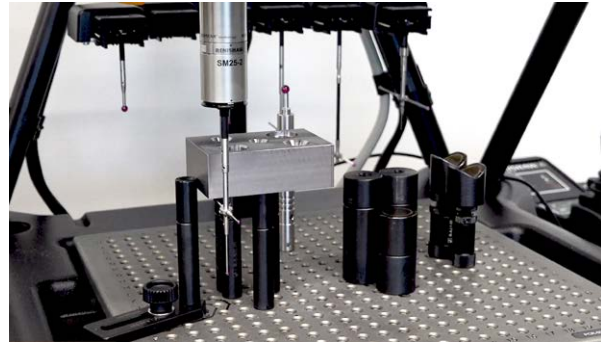
Sistema di ispezione Equator che ispeziona un pezzo lavorato