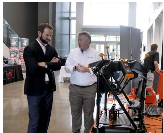
Presentazione del pacchetto di ispezione Equator per NIMS presso la conferenza annuale Haas Tech (HTEC)