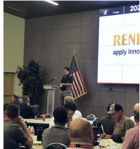
Renishaw è orgogliosa di sponsorizzare la conferenza HTEC