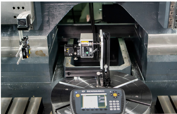
Misura dell'ortogonalità con il sistema di allineamento laser XK10