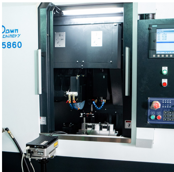
Interferometro laser XL-80 usato da Dawn Machinery per verificare l'accuratezza dinamica delle macchine utensili

Il successo commerciale delle nostre macchine utensili è fondato sull'efficienza e sulla cura del dettaglio. Durante la fase di assemblaggio delle macchine è importante riuscire a individuare e correggere tutti gli errori in modo rapido e accurato. Inoltre, un altro fattore da tenere sempre sotto controllo è il costo della manodopera. A seguito dell'aumento della domanda, Dawn Machinery Co., Ltd (Dawn Machinery) ha deciso di sostituire i suoi vecchi sistemi metrologici, composti da blocchi di granito e comparatori passando al sistema di allineamento laser XK10 di Renishaw.