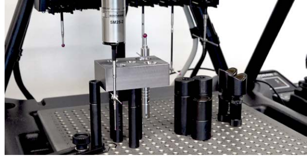
Système de comparaison Equator de Renishaw inspectant une pièce usinée NIMS