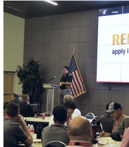
Renishaw est fier de parrainer la conférence HTEC