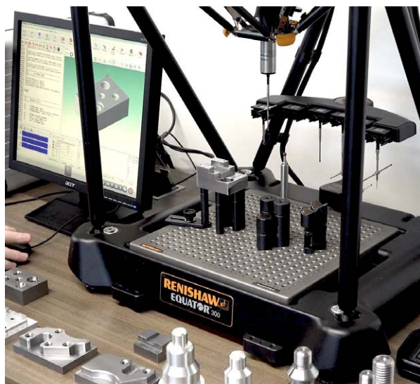
Le pack complet pour système de comparaison Equator de Renishaw pour NIMS

Pour maintenir les niveaux de compétence des étudiants aux normes actuelles de l'industrie manufacturière, de nombreuses écoles de commerce aux États-Unis ont aligné leur formation sur la certification de l'Institut national des compétences en métallurgie (National Institute of Metalworking Skills - NIMS). Adaptés spécifiquement à cette initiative, Renishaw, la multinationale de technologies industrielles, a développé un pack pour système de comparaison Equator™ qui améliore considérablement l'inspection des pièces NIMS. Renishaw s'assure que le système est facile à utiliser et que les utilisateurs sont bien pris en charge à chaque étape.