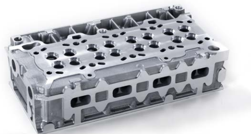
Culasse de moteur après usinage des faces

« En tant qu'entreprise travaillant sur un marché véritablement mondial, nous nous battons tous les jours pour nous démarquer et rester en tête de la compétition. Les investissements dans de nouvelles méthodes et techniques de production ne sont pas seulement liés à l'efficacité, à la qualité et à l'élimination des rebuts, ils s'attachent à rendre notre travail plus attrayant et intéressant, ainsi qu'à anticiper les futurs besoins des clients. »