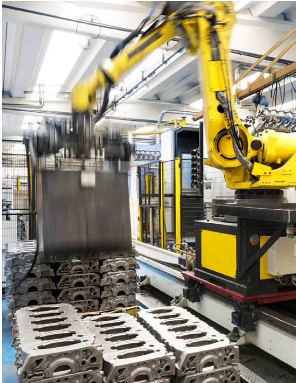
OMG est spécialisé dans l'usinage mécanique des métaux

La qualité, bien entendu, s'avère un pilier essentiel de l'entreprise OMG. Bien avant l'avènement des normes internationales de qualité, la société a créé ses propres méthodes, contrôles et documentations pour assurer le respect des tolérances et la cohérence de la fabrication. Aujourd'hui, l'entreprise est certifiée selon les normes requises automobiles et environnementales ISO.