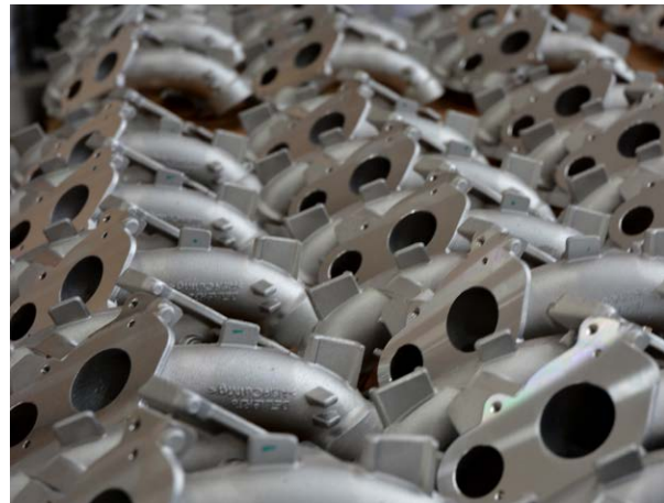
Ejemplo de piezas fabricadas en R. Busi

Para obtener más información, visite www.renishaw.es/busi