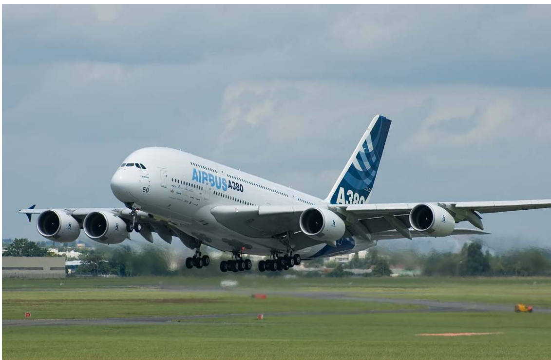
Escribano suministra componentes de precisión a Airbus.