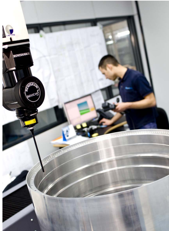
REVO escaneando una gran circunferencia en un componente aeroespacial.

Es cierto que en muchos aspectos, la fabricación se está simplificando, por lo menos en lo que concierne a la tecnología disponible. Por ejemplo, las Máquinas-Herramienta son más sencillas de programar y utilizar, el prototipado rápido significa que el desarrollo de producto es más rápido y económico que antes, y el software CAD fácil de usar, puede incluso eliminar completamente la necesidad de prototipos físicos. Todo esto implica que lo que estás haciendo actualmente, o intentando hacer, es relativamente poco complejo. Otra cosa es, sin embargo, si estás construyendo sofisticados sistemas aeronáuticos multimillonarios, como los realizados por Mecanizados Escribano.