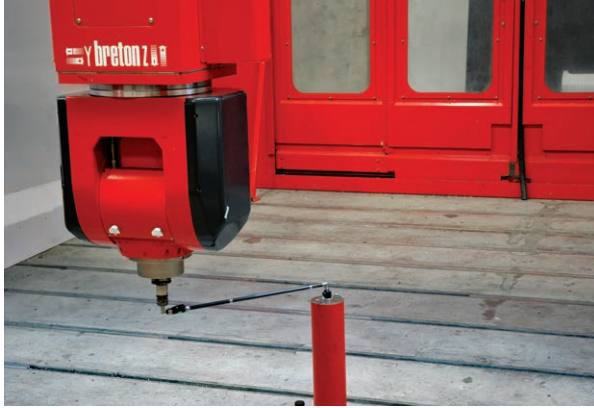
Breton은 Renishaw의 QC20-W 볼바를 사용해 기계 위치 성능을 점검합니다.