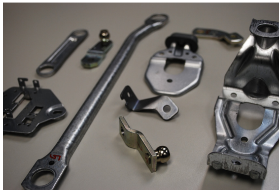
Eponsa proizvodi sve dijelove za mehanizme brisača vjetrobranskog stakla prema postupcima oblikovanja metala deformiranjem

Kod Eponse argumentiraju: „Equator bi mogao skratiti ili ukinuti vrijeme čekanja u odjelu za kontrolu kvalitete. Equator naime može raditi u radionici, uz strojeve koji proizvode dijelove, a zbog niskih troškova nabave možete si priuštiti više Equatora koji se smještaju tamo gdje su potrebni.