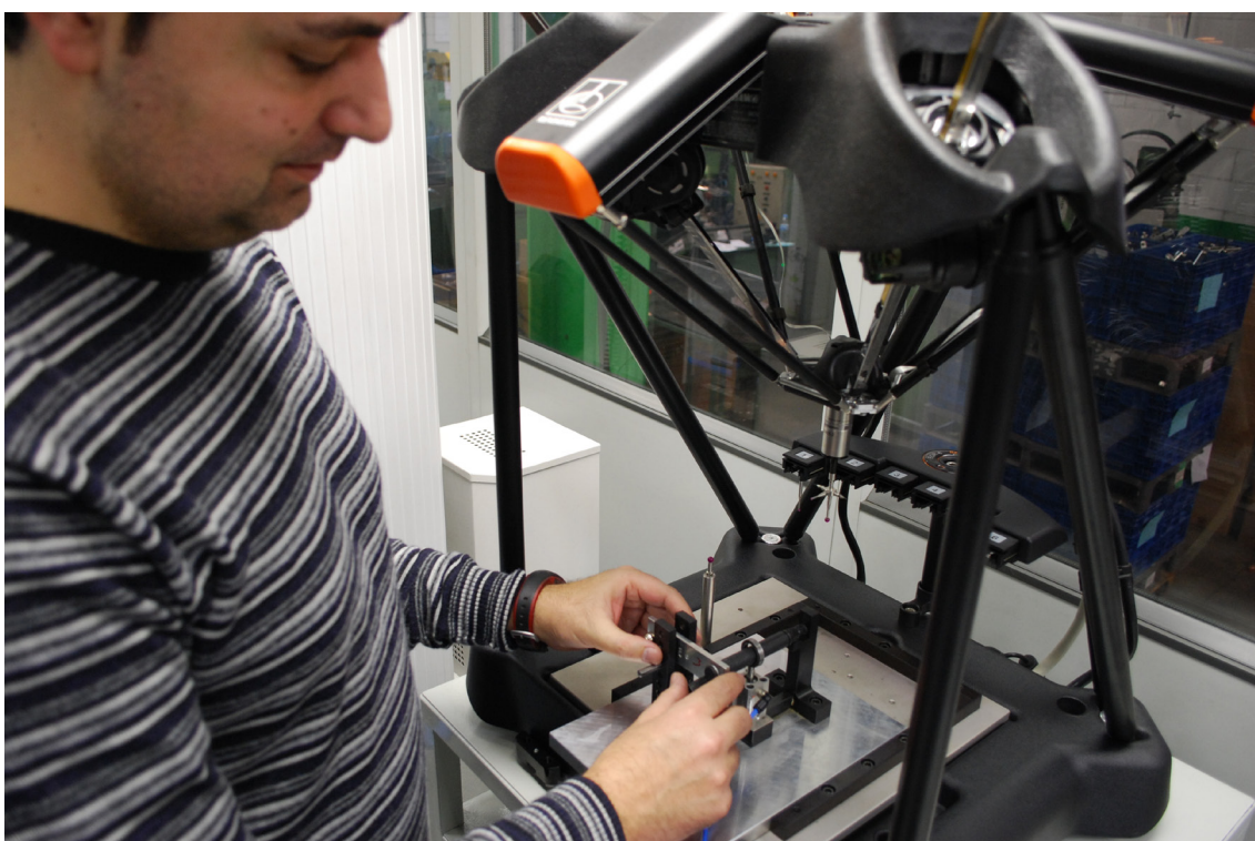
Inženjer tvrtke Eponsa umeće mehanizam brisača u Equator koji je spreman za mjerenje

Eponsa vjeruje da će Equator biti dobro prihvaćen u radionici jer će osjetno smanjiti radno opterećenje. Operatori tvrtke Eponse svaki dan provjere tisuće proizvoda prema dokumentiranim postupcima.