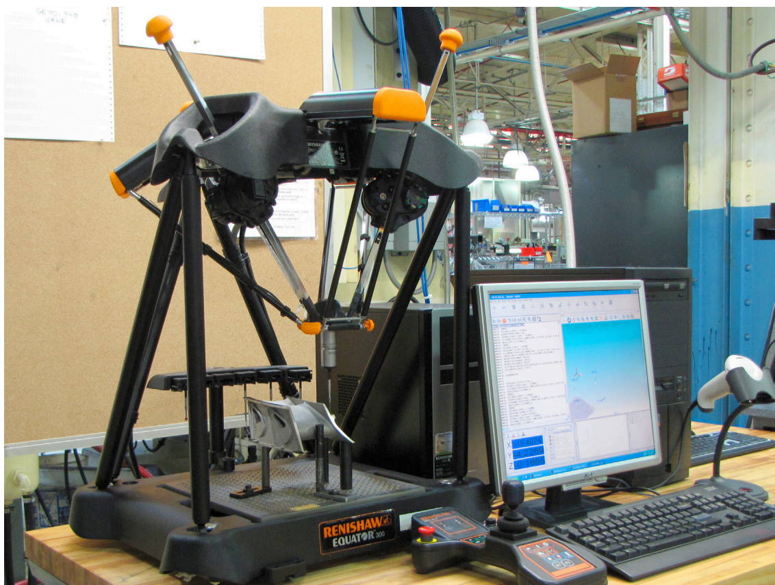
Ogni Equator è in grado di svolgere la funzione di diversi calibri rigidi e può essere riconfigurato con una semplice programmazione

Per le misure dimensionali in processo nelle celle di lavoro, l'azienda si affida a calibri a contatto punto-punto con sonde digitali pneumatiche. Questi calibri rigidi, utilizzati in ciascuna cella di lavoro, sono molto rapidi, ma anche molto costosi.