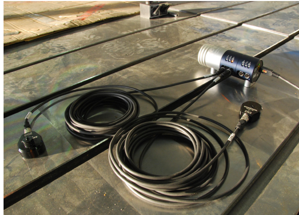
I sensori collegati all'unità di compensazione XC-80 misurano la temperatura e la pressione dell'aria, rendendo possibile l'esecuzione dei test in qualsiasi condizione ambientale

A questo punto il software Renishaw calcola i dati di correzione per compensare eventuali errori. Oltre alla posizione lineare, il sistema è in grado di misurare la rettilineità delle guide, la planarità delle tavole e la variazione dell'angolo nello spostamento degli assi.