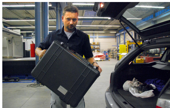
Il laser XL-80 può essere comodamente trasportato in una piccola valigia

I LED presenti nella parte superiore di XL-80 rendono più semplice l'allineamento, perché permettono di visualizzare l'intensità del fascio senza dover fare continuamente avanti e indietro dal PC."