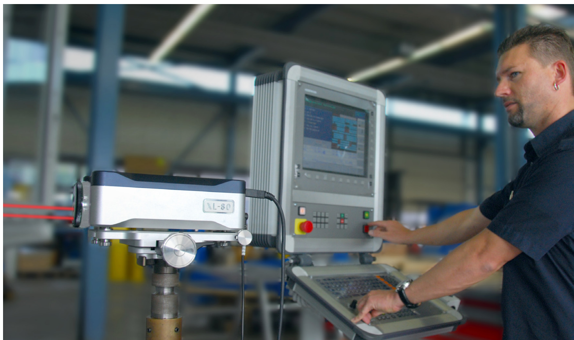
Il laser XL-80 è più rapido e facile da allineare, per ridurre i tempi di lavoro