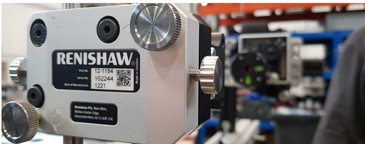
Komplet za vzporednost XK10, poravnan z osjo stroja

»S sistemom XK10 smo izboljšali merilne procese na večjih strojih,« poroča Similä. »Med tem projektom smo uporabili XK10 za merjenje stroja med montažo, da bi preverili, ali so osi ravne vzdolž osi gibanja, in izmerili stroj, ko je nameščen. Ko smo se bolje seznanili s procesom, smo začeli spremljati tudi zunanje dejavnike, ki lahko vplivajo na meritve, denimo spremembe v okolju. Vhodne parametre za teste preprosto vnesemo prek zaslona XK10, z vsestranskim kompletom vpenjal pa lahko preprosto kontroliramo različne meritve. Identificirali smo tudi priložnosti za uporabo sistema XK10 na strojih v prihodnje.«