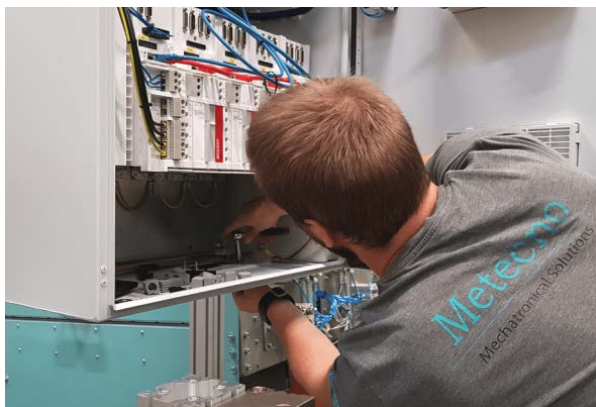
Inženir podjetja Metecno Oy med sestavljanjem CNC-stroja