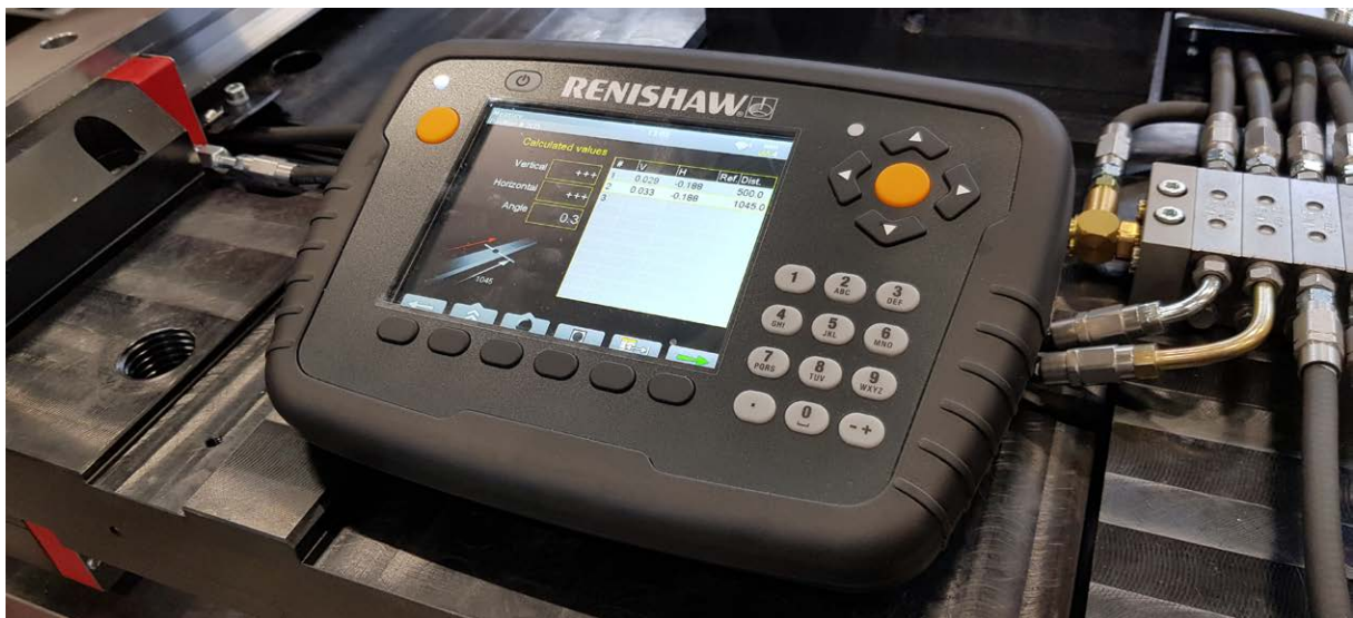
Povratne informacije v živo s prenosnim displejem XK10

Za več informacij obiščite www.renishaw.si/xk10