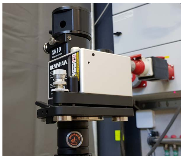
Laserska enota XK10 zagotavlja vsestranske možnosti vpenjanja

So eden od maloštevilnih proizvajalcev na Finskem, ki projektira in gradi CNC-stroje po meri. Posel jim zato hitro raste vse od ustanovitve in z optimističnimi obeti za prihodnost. Leta 2021 so zabeležili rekordnih 1,2 milijona evrov prometa.