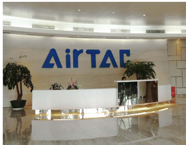
AiTAC 닝보 제조 공장, 중국

1988년 대만에 설립된 AirTAC은 3개의 대규모 제조 공장을 가동하고 있으며, 대만의 타이난, 중국의 광둥과 닝보에 각각 소재하고 있습니다. 닝보 소재 AirTAC은 400,000 m 2 규모 부지에 39개의 공장을 가동하고 있습니다. 이곳에는 1,000 개 이상의 공장 기계와 기타 생산 장비들이 설비되어 있고, 한 부서에서 3,000개 이상의 개별 번호가 매겨진 구성품들을 생산하고 있습니다.