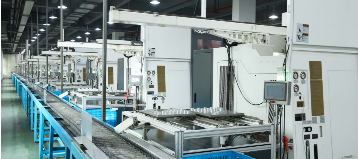
AirTAC의 자동화 생산 라인