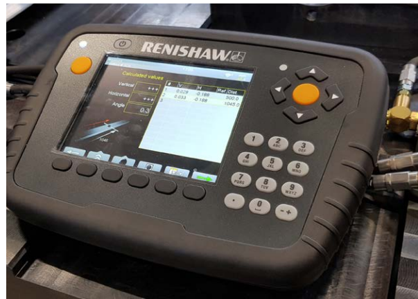
Feedback in diretta con l’unità di visualizzazione portatile del sistema XK10

Per ulteriori informazioni, visita www.renishaw.it/xk10