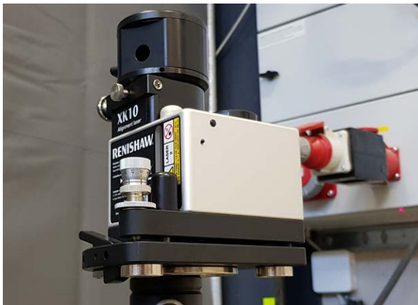
Soluzione di fissaggio versatile fornita con l’unità di trasmissione del sistema XK10