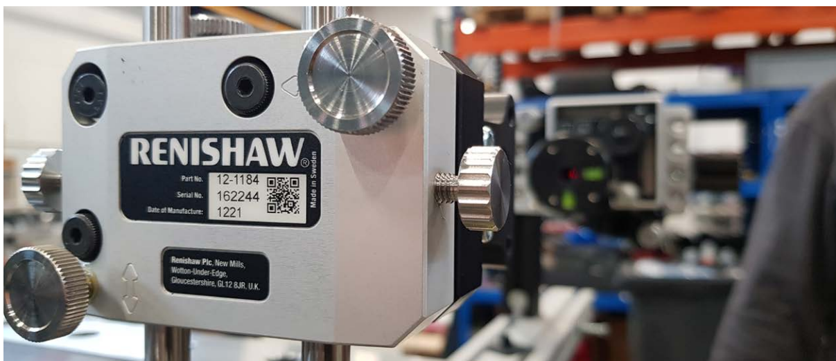
Kit parallelismo XK10 allineato all'asse della macchina

“Il sistema XK10 ci ha permesso di migliorare i nostri processi di misura per le macchine più grandi” spiega Similä. “Nel corso di questo progetto abbiamo utilizzato il sistema XK10 per misurare la macchina sia durante l'assemblaggio, per verificare che gli assi fossero dritti sull'intero asse di corsa, sia a seguito dell'installazione. Acquisire maggiore familiarità con il processo ci permetterà di monitorare i fattori esterni che possono influenzare la misura, come l'effetto delle variazioni ambientali. Inserire i parametri del test nell'unità di visualizzazione XK10 è facile, così come utilizzare il kit di fissaggio per controllare con semplicità un'ampia gamma di misure. Abbiamo inoltre identificato dove potremo utilizzare il sistema XK10 sui futuri macchinari.”